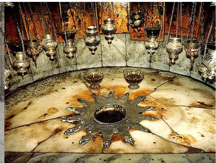
耶穌的誕生地：伯利恆